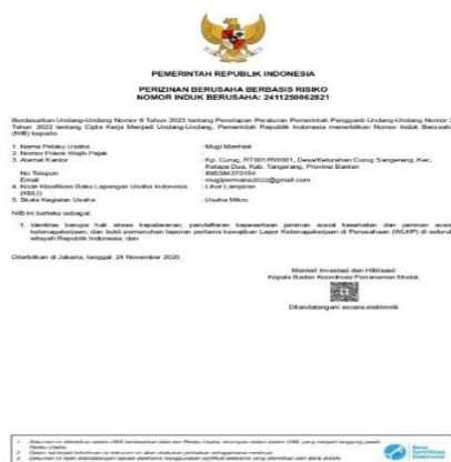
Gambar 1. NIB Warung Teras Kuning

Setelah SPPL disetujui dan tersinkronisasi dengan OSS, tahapan akhir dilakukan sehingga NIB resmi diterbitkan secara digital, dapat diunduh, dan berfungsi sebagai identitas legal usaha.