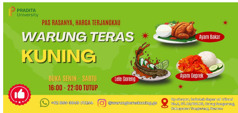
Gambar 5. Spanduk Warung Teras Kuning