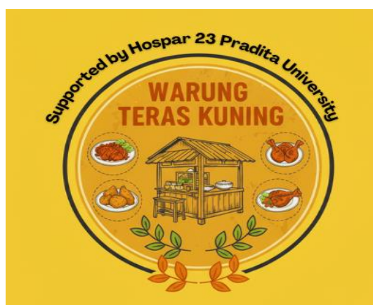
Gambar 3. Logo Warung Teras Kuning

Selain melakukan pendampingan pada legalitas usaha dari UMKM Warung Teras Kuning, pendampingan juga dilakukan pada media promosi dengan melakukan branding pada UMKM Warung Teras Kuning. Branding yang dilakukan adalah pembuatan logo, menu dan spanduk UMKM Warung Teras Kuning, sehingga memiliki tampilan baru yang lebih menarik dan mudah dikenali oleh pembeli.