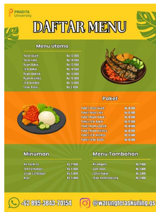
Gambar 4. Menu Makanan Warung Teras Kuning