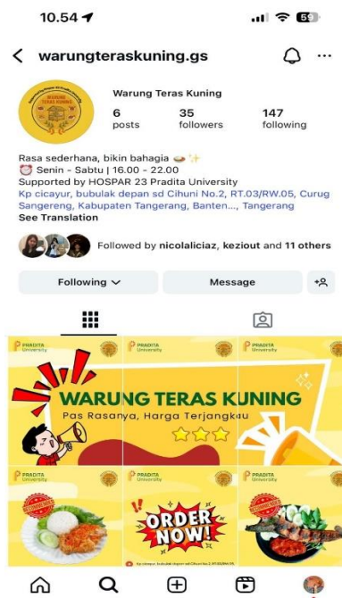
Gambar 6. Media Sosial Instagram Warung Teras Kuning

Pendampingan terakhir dilakukan melalui pemanfaatan media sosial, yaitu Instagram dan TikTok, dengan tujuan memperluas jangkauan informasi mengenai UMKM Warung Teras Kuning agar tidak terbatas pada konsumen yang berkunjung langsung ke kawasan Gading Serpong, Tangerang. Selain itu, pendampingan melalui Instagram diarahkan untuk membangun jejak digital usaha sekaligus menjadi salah satu sarana promosi yang efektif.