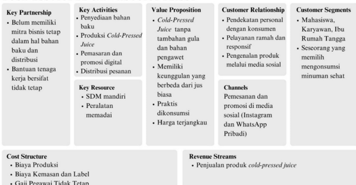
Gambar 1. Business Model Canvas Awal Juicy Blissy