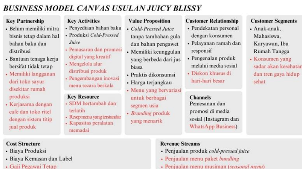
Gambar 3. Business Model Canvas Usulan Juicy Blissy

Setelah mendapatkan strategi-strategi alternatif menggunakan analisis SWOT dan VRIO Framework , dihasilkan pembaruan strategi yang ditambahkan dalam Business Model Canvas . Menurut Hoffman (2000) suatu perusahaan dapat dikatakan memiliki keunggulan berkelanjutan apabila mampu menerapkan strategi penciptaan nilai yang unik dan tidak dapat dijalankan atau ditiru oleh pesaing lain. Berikut adalah strategi yang ditambahkan dalam Business Model Canvas usulan Juicy Blissy :