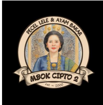
Gambar 1. Logo