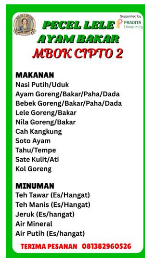
Gambar 4. Menu Terbaru

Desain menu diperbaharui secara visual dan informatif. Banner juga terdapat pembaharuan dari pencantuman logo terbaru dan informasi terkait menu. Desain menu yang menarik secara visual dan sederhana dapat memudahkan pesanan para konsumen terhadap pelaku UMKM.