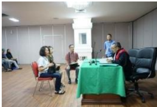
Gambar 4. Pelaksanaan Program Lontong Balap

“Baik sejauh ini, buktinya ya setiap tahun nanti perpanjangan, kalau misal pimpinannya baru ya nanti diajukan pembaharuan. Karena ya kita pelayanan masyarakat kerja sama ini ya penting”. (Wawancara, 29 September 2024).