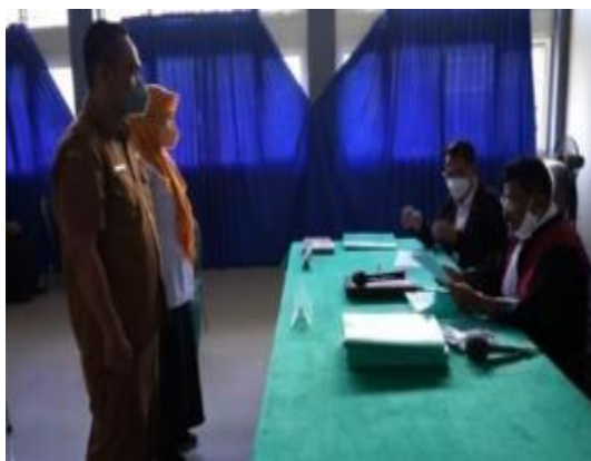
Gambar 2. Penandatanganan Perjanjian Kerjasama (PKS)

Peran dari Pemerintah Kota Surabaya adalah memberikan kebebasan sebesar-besarnya kepada dinas ataupun instansi untuk selalu berinovasi untuk memberikan layanan publik yang lebih baik, lebih efektif, dan efisien kepada masyarakat Kota Surabaya. Hal tersebut dibuktikan dengan inovasi pelayanan publik yang bernama Lontong Balap (Layanan Online One Gate System Terpadu antara Pengadilan Negeri dan Disdukcapil Surabaya) mendapatkan penghargaan Top 30 Kompetisi Inovasi Pelayanan Publik (Kovablik) Pemprov Jatim pada 2022 lalu.