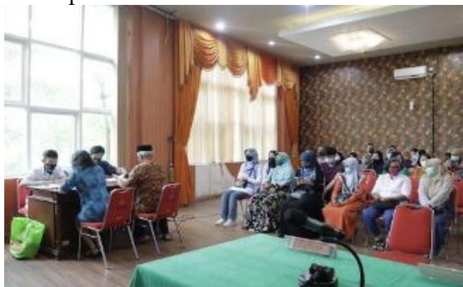
Gambar 7. Pelaksanaan Sidang Lontong Balap

Hal tersebut juga didukung dengan pelaksanaan sidang penetapan Lontong balap yang banyak dilaksanakan di Mall Pelayanan Publik Siola, hal tersebut di fasilitasi oleh Disdukcapil Surabaya selaku pihak yang menginisiasi, dengan adanya hal tersebut, pemohon tidak perlu bingung lagi harus ke Pengadilan Negeri dulu untuk sidang penetapan, kemudian setelah sidang telah dilaksanakan menuju ke Disdukcapil Kota Surabaya di Mall Pelayanan Publik Siola. Pemohon hanya perlu datang ke Mall Pelayanan Publik Siola saja untuk melaksanakan sidang penetapan, dan juga menyerahkan dokumen hasil penetapan tersebut kepada Disdukcapil Kota Surabaya untuk diajukan sebagai permohonan update data kependudukan mereka.