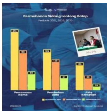
Gambar 1. Data Permohonan Sidang Lontong Balap

Selain menunjukkan peningkatan jumlah permohonan, tren tersebut mengindikasikan adanya peningkatan kepercayaan masyarakat terhadap pelayanan terpadu yang diselenggarakan oleh Disdukcapil Kota Surabaya dan Pengadilan Negeri Surabaya. Berdasarkan data permohonan, jumlah sidang Lontong Balap meningkat dari 181 permohonan pada tahun 2021 menjadi 587 permohonan pada tahun 2023. Kenaikan tersebut mencapai sekitar 224 persen dalam kurun waktu dua tahun. Peningkatan ini menunjukkan bahwa masyarakat semakin memanfaatkan mekanisme pelayanan terpadu dibandingkan prosedur konvensional yang mengharuskan pemohon mengurus penetapan pengadilan dan administrasi kependudukan secara terpisah. Meningkatnya jumlah penduduk Kota Surabaya berimplikasi pada tingginya kebutuhan pelayanan administrasi