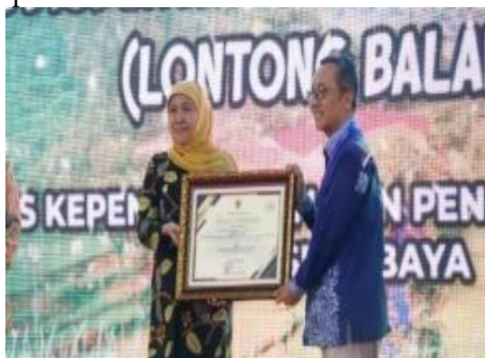
Gambar 3. Penerimaan Penghargaan Kovablik 2022

Peran dari Pemerintah Kota Surabaya adalah memberikan kebebasan sebesar-besarnya kepada dinas ataupun instansi untuk selalu berinovasi untuk memberikan layanan publik yang lebih baik, lebih efektif, dan efisien kepada masyarakat Kota Surabaya. Hal tersebut dibuktikan dengan inovasi pelayanan publik yang bernama Lontong Balap (Layanan Online One Gate System Terpadu antara Pengadilan Negeri dan Disdukcapil Surabaya) mendapatkan penghargaan Top 30 Kompetisi Inovasi Pelayanan Publik (Kovablik) Pemprov Jatim pada 2022 lalu.